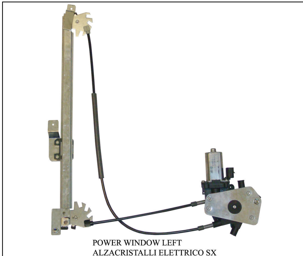
POWER WINDOW LEFT ALZACRISTALLI ELETTRICO SX

left door - portière gauche - linke tür - puerta lado izquierdo - porta esquerda - porta lato sinistro