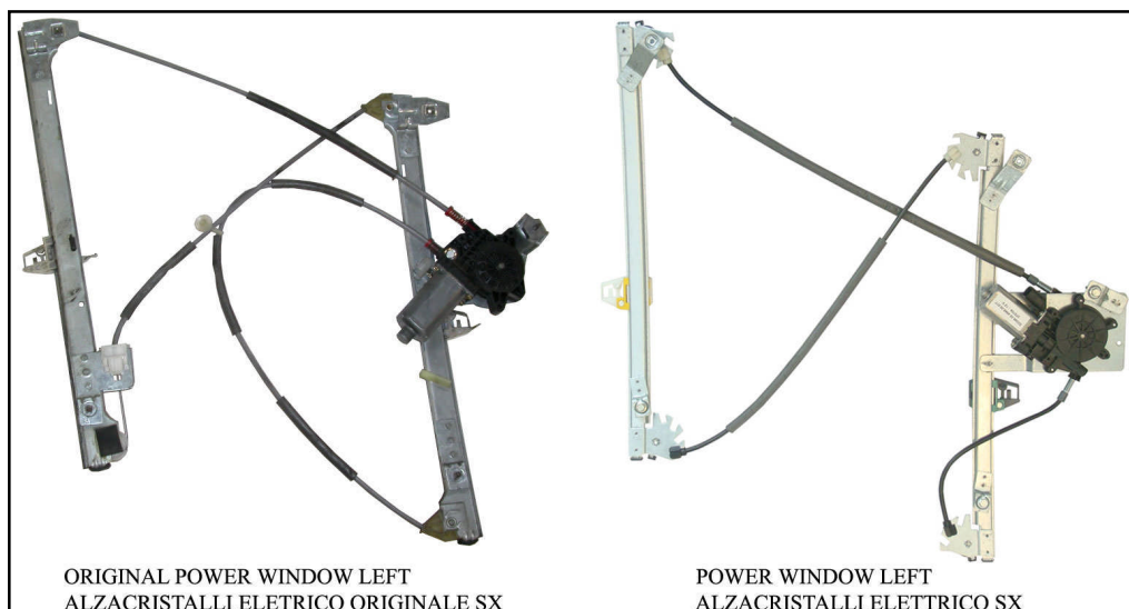
ORIGINAL POWER WINDOW LEFT ALZACRISTALLI ELETRICO ORIGINALE SX

LA PRESENTE ISTRUZIONE VALE SIA PER IL LATO SINISTRO CHE PER IL LATO DESTRO.