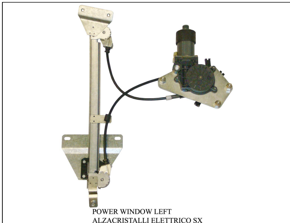
POWER WINDOW LEFT

LA PRESENTE ISTRUZIONE VALE SIA PER IL LATO SINISTRO CHE PER IL LATO DESTRO.