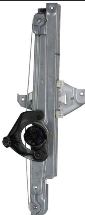
ORIGINAL POWER WINDOW RIGHT ALZACRISTALLI ELETTRICO ORIGINALE DX

LA PRESENTE ISTRUZIONE VALE SIA PER IL LATO SINISTRO CHE PER IL LATO DESTRO.