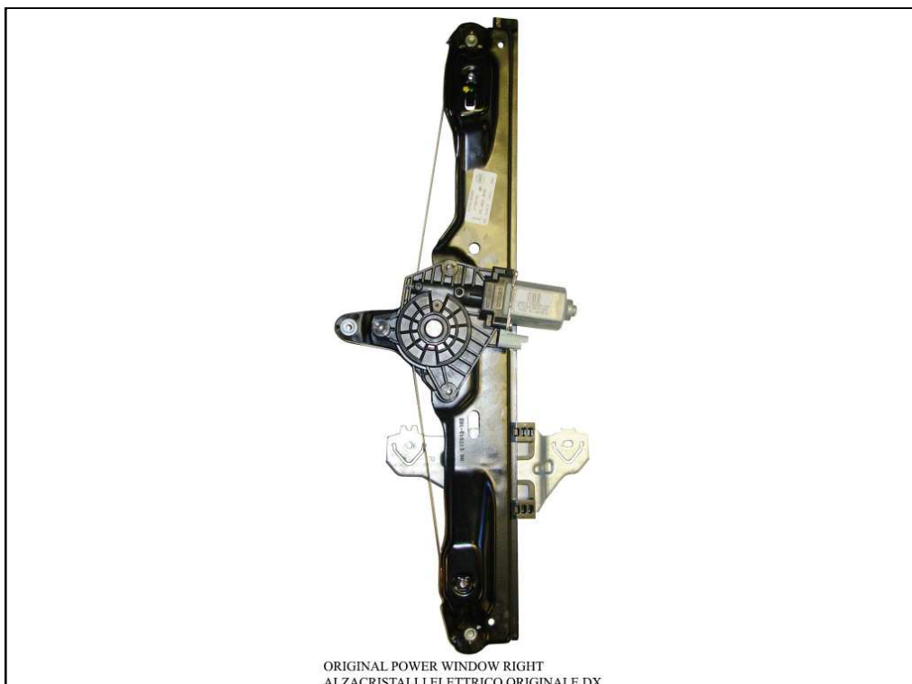
ORIGINAL POWER WINDOW RIGHT ALZACRISTALLI ELETTRICO ORIGINALE DX

LA PRESENTE ISTRUZIONE VALE SIA PER IL LATO SINISTRO CHE PER IL LATO DESTRO.