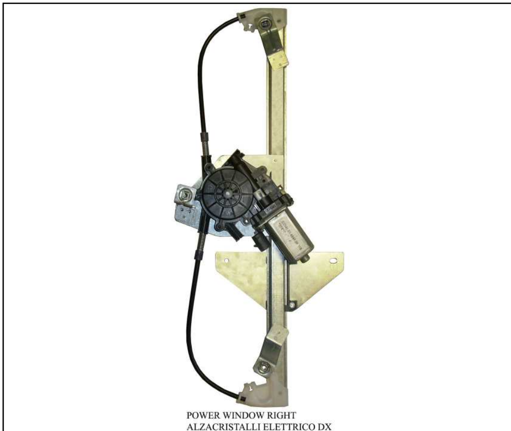
POWER WINDOW RIGHT ALZACRISTALLI ELETTRICO DX

right door - portière droite - rechte tür - puerta lado derecho - porta direita - rechterportier - porta lato destro