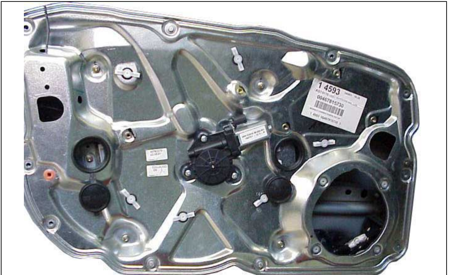
4 Doors - 4 Portes - 4 Türieg - 4 Puertas - 4 Porte Front Doors - Portes Avant - Vordere Türen - Puertas Anteriores - Porte Anteriori left door- portière gauche - linke tür - puerta lado izquierdo - porta lato sinistro