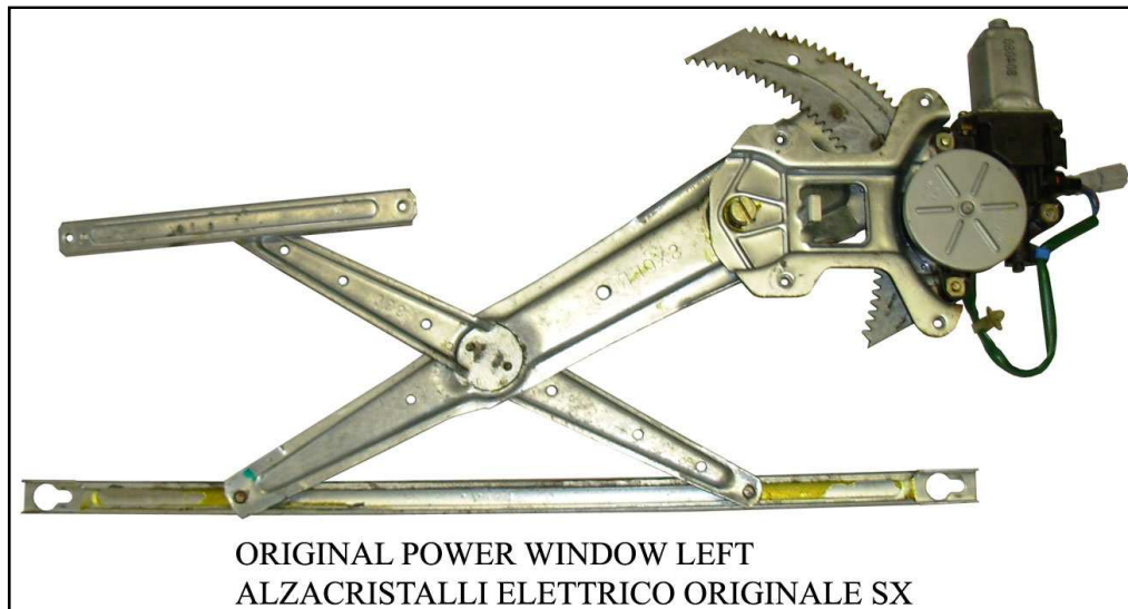
ORIGINAL POWER WINDOW LEFT ALZACRISTALLI ELETTRICO ORIGINALE SX

LA PRESENTE ISTRUZIONE VALE SIA PER IL LATO SINISTRO CHE PER IL LATO DESTRO.