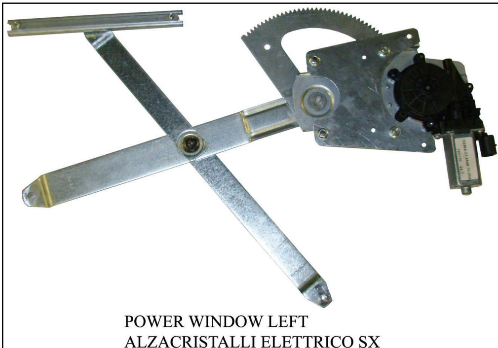
POWER WINDOW LEFT ALZACRISTALLI ELETTRICO SX

left door - portière gauche - linke tür - puerta lado izquierdo - porta esquerda - porta lato sinistro THIS INSTALLATION INSTRUCTION IS FOR BOTH LEFT AND RIGHT SIDE. CETTE INSTRUCTION DE MONTAGE EST POUR LES DEUX COTES DROIT ET GAUCHE. DIESE MONTAGE-ANLEITUNG IST FÜR DIE BEIDE LINKE UND RECHTE SEITE. ESTA INSTRUCCION DE MONTAJE ES PARA LOS DOS LADOS IZQUIERDO Y DERECHO. LA PRESENTE ISTRUZIONE VALE SIA PER IL LATO SINISTRO CHE PER IL LATO DESTRO.