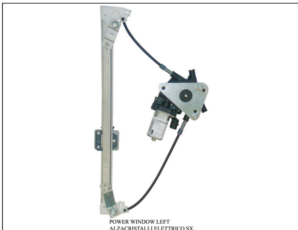
POWER WINDOW LEFT

LA PRESENTE ISTRUZIONE VALE SIA PER IL LATO SINISTRO CHE PER IL LATO DESTRO.