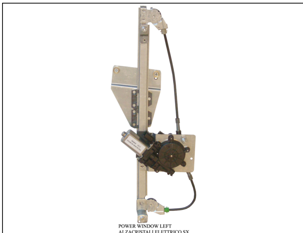
POWER WINDOW LEFT ALZACRISTALI ELETTRICO SX

LA PRESENTE ISTRUZIONE VALE SIA PER IL LATO SINISTRO CHE PER IL LATO DESTRO.