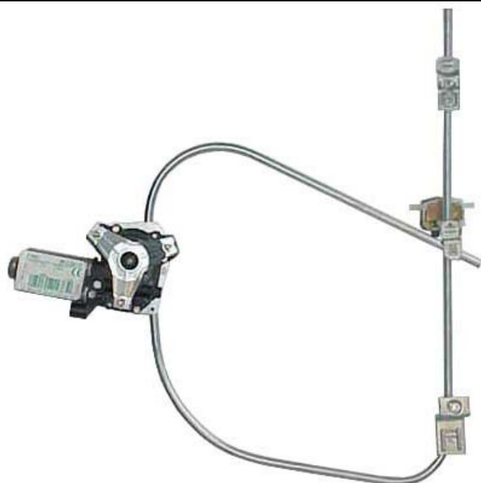
ORIGINAL POWER WINDOW RIGHT ALZACRISTALLI ELETTRICO ORIGINALE DX

LA PRESENTE ISTRUZIONE VALE ANCHE PER L'ALZACRISTALLI DELLA MANO OPPOSTA.