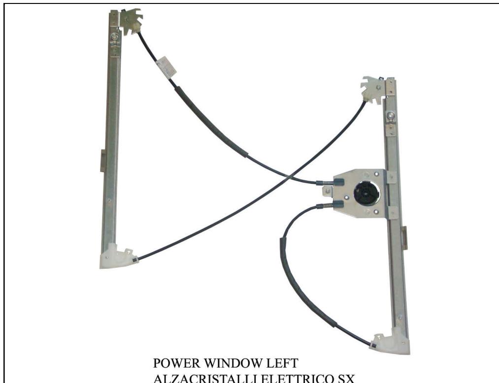
POWER WINDOW LEFT

LA PRESENTE ISTRUZIONE VALE SIA PER IL LATO SINISTRO CHE PER IL LATO DESTRO.